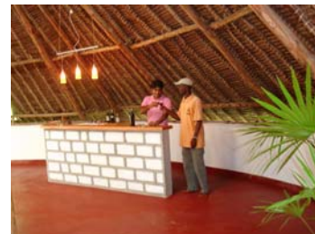
Bar im Wohnbereich (Die Barstühle sind in der zwischenzeit fertig gestellt)