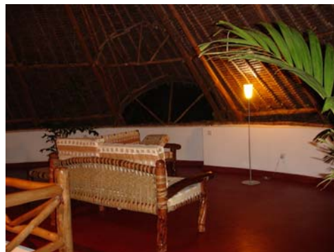
Wohnzimmer (Fernseher und DVD sind in der zwischenzeit installiert)