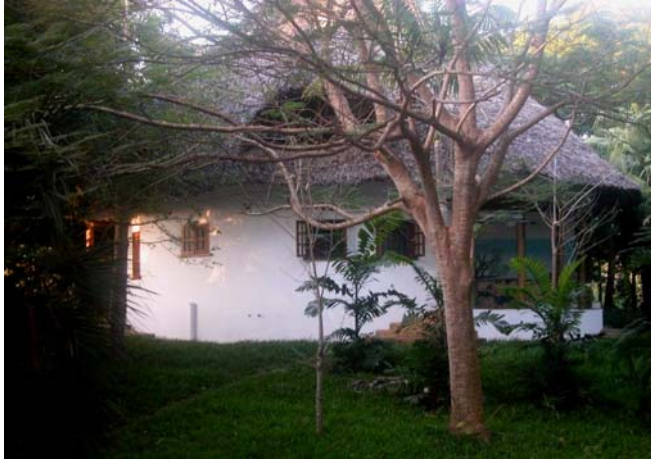
Aussenansicht vom Garten aus.